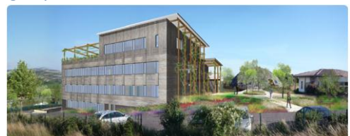
Le siège d'ECO CERT, basé dans le Gers, France